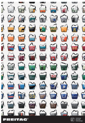
Freitag: Jede Tasche ein Unikat

www.consulting.ch oder www.i2s-consulting.com